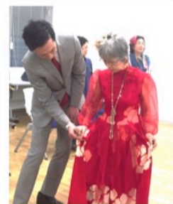
事前にウォーキン グレッスン