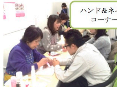
ハンド&ネイル コーナー

1月31日「笑顔フェスタ」みなとパーク芝浦にて、無料イベント開催。限定10組の港区在住プラチナ世代にプロカメラマンによる写真撮影会。メイクサービス、パーソナルカラー、アロマ、ハンド&ネイルコーナー、お楽しみステージ、司法書士、弁護士による相談コーナーも設けました。