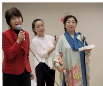
フォーマルメイクデモと解説

大井町 きゅりあんにて、シニアビューティ ファッションショー。最高齢75才から60代の塾生がモデルで、シニア&ハンディ企画の菊池先生デザイン の着物リメイクファッションにトータルコーディネート&プラチナ メイクで堂々のウォーキング。会場が一段と華やぎました。 また、会場内に眉メイク、耳ツボジュエリーのコーナーを 設け、60名の方々に体験していただき、 いつもと違う自分を楽しんでいただきました。