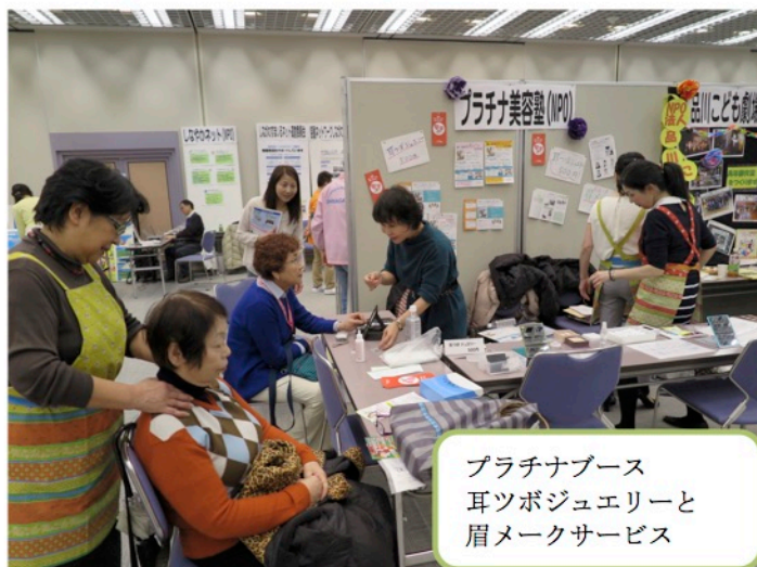
プラチナブース 耳ツボジュエリーと 眉メイクサービス