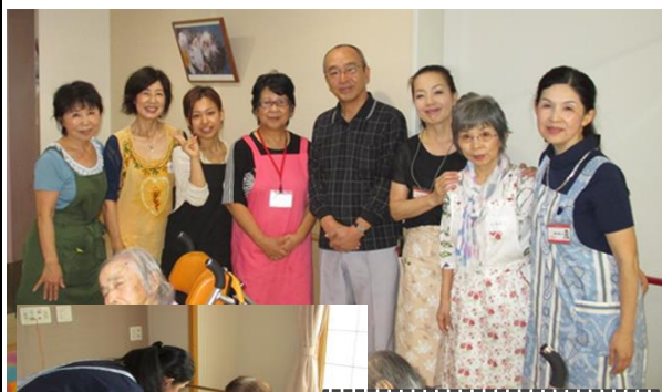
9月 敬老の日 かえで荘 60名メイク 美容ボランティア 7名