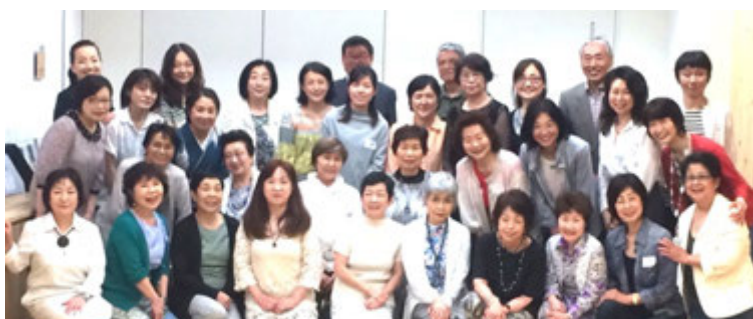
5月『第2回総会』 会員33名大集合！