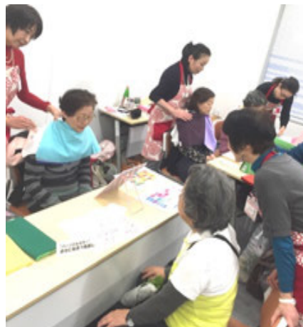
★11月『港区介護予防フェア』 パーソナルカラーとアロマ