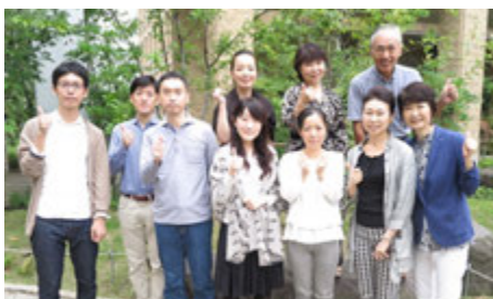
6～11月外部メンバー協力によりプロボノチーム結成 『営業資料』作成