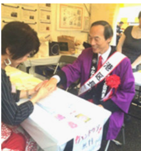
CC ブース ハンドケア体験 区長もニコリ！