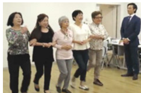
プラチナ会 月例開催