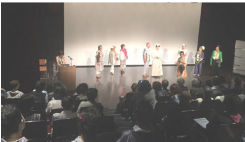
★6月『港区リーブラまつり』にてファッションショー シニアブライダルに皆んなうっとり！ 満員御礼