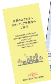
企業向けパンフレット