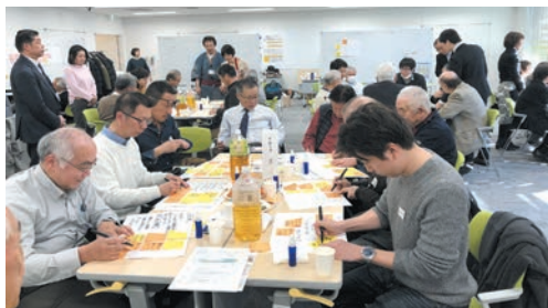
70名近いメンズが地域活動を検討・発表