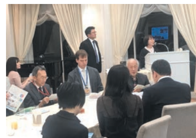
2月企業ボランティアの祭典 『メンズ講座』報告(参加者100名)