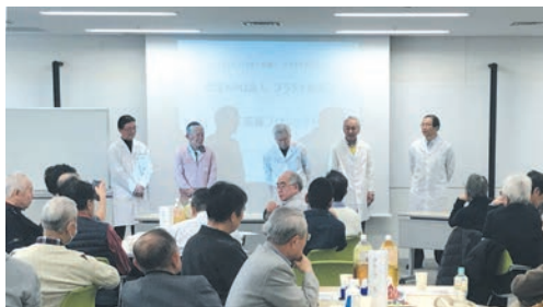
プラチナ美容塾でアロマ先行メンズ紹介