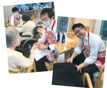
プロボノメンズが ボランティア体験